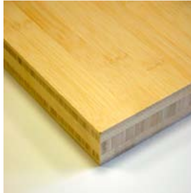
Moso® Pannello Orizzontale Naturale