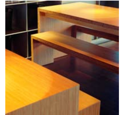
Moso® Pannello Verticale Naturale

Moso® Tranciato Verticale / Pannello Density, Tostato