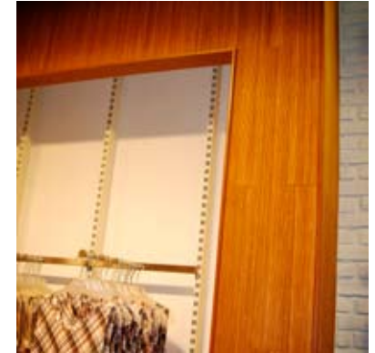
Moso® Bamboo in rotoli flessibili Panda Tostato