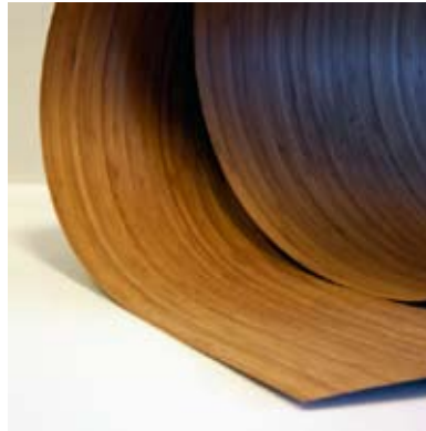
Moso® Tranciato Verticale Tostato