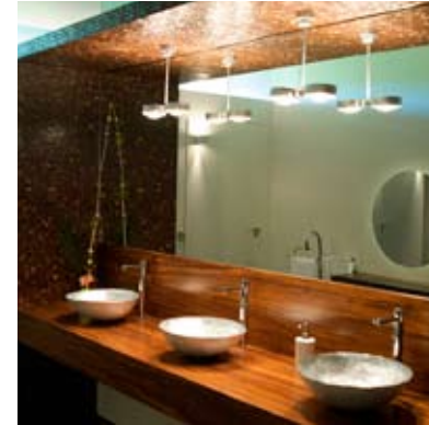
Moso® Pannello Density Tostato