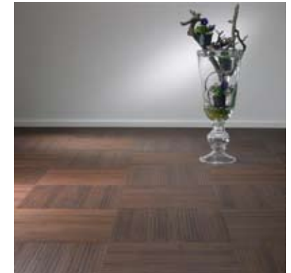
Moso® Piastrella Pandaflex Coloniale