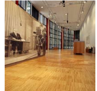
Moso® Pavimento Industriale Tostato Senza Bisellatura