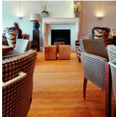
Moso® Parquet Orizzontale Tostado