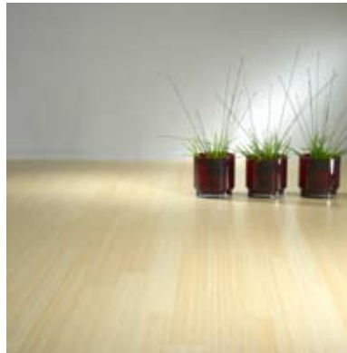
Moso® Parquet Verticale Naturale