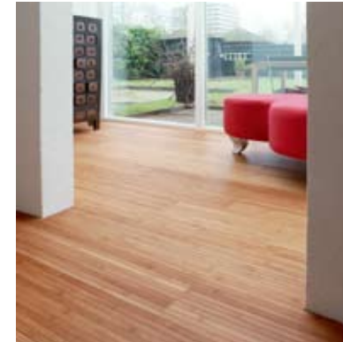
Moso® Unibamboo Tostado